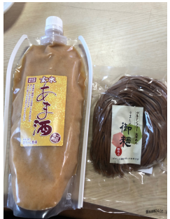
玄米甘酒・米粉麺