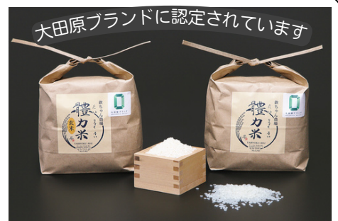
大田原ブランドに認定されています 体力米（たいりょくまい）