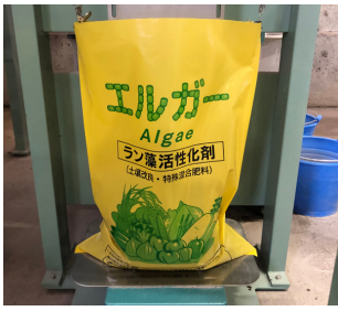
土壤改良資材 エルガー